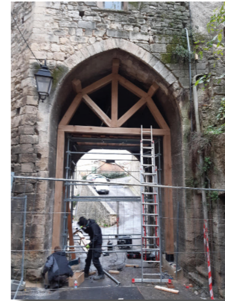
Porte des Cordeliers

Cet automne, les entreprises de Forcalquier ARBATS - les arbres bâtisseurs et SOGETRAV 04 ont consolidé la porte des Cordeliers.