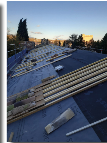
Toit du Couvent des Cordeliers

Bellec Rénovation, entreprise de Pertuis, spécialiste des couvertures monuments historiques, est intervenue pour restaurer 400 m 2 de toiture du Couvent des Cordeliers sous le contrôle d'un architecte du patrimoine.