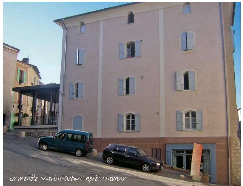
immeuble Marius-Debout après travaux