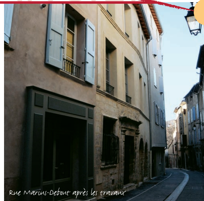
Rue Marius-Debout après les travaux