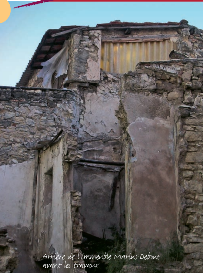
Arrière de l'immeuble Marius-Debout avant les travaux