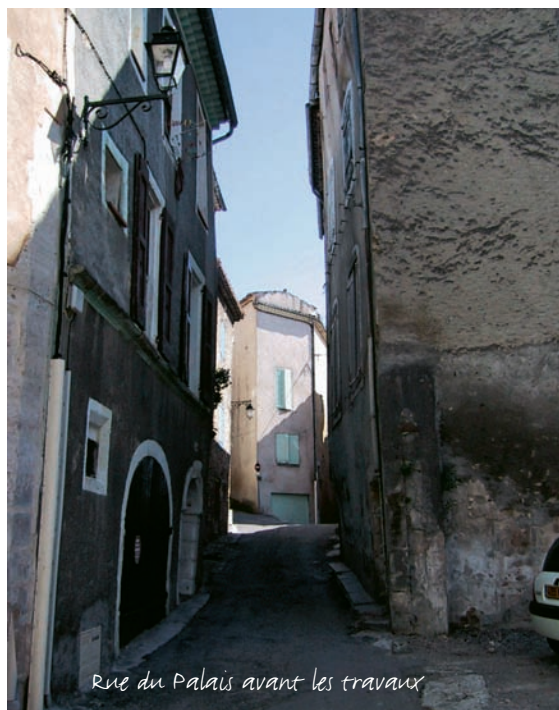
Rue du Palais avant les travaux